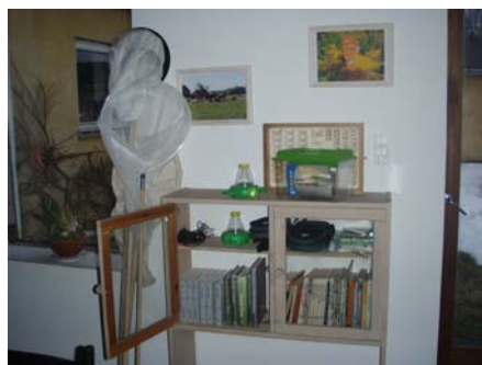
Her er net, mikroskoper og bøger til at studere insekter, blomster mv.

Vi har stor erfaring med besøg af grupper bl.a.: