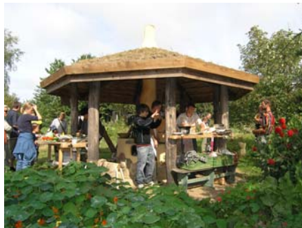
Aktivitet i ildhuset