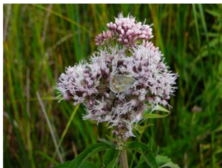
Hvad mon blomsten hedder?